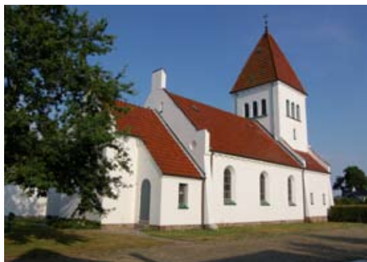
Sct. Jørgens kirke