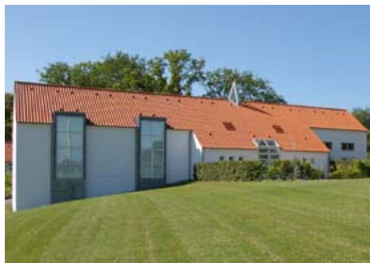
Høje Kolstrup kirke