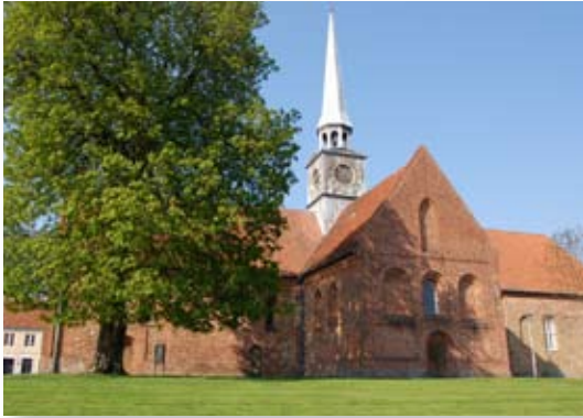
Sct. Nicolai kirke