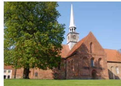
Sct. Nicolai kirke

Mandag d. 1. (2. pinsedag) kl. 10.00 ved fællesgudstjeneste ved Sønderstrand