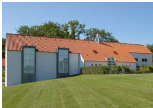
Høje Kolstrup kirke