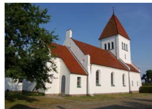
Sct. Jørgens kirke