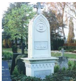
Eksempel på bevaringsværdigt gravminde

gravsted og monument m.m., hvorved den tidligere gravstedslejers rettigheder over gravstedet bortfalder.